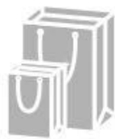
Jewelry paper bag