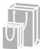
Jewelry paper bag