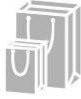
Jewelry paper bag